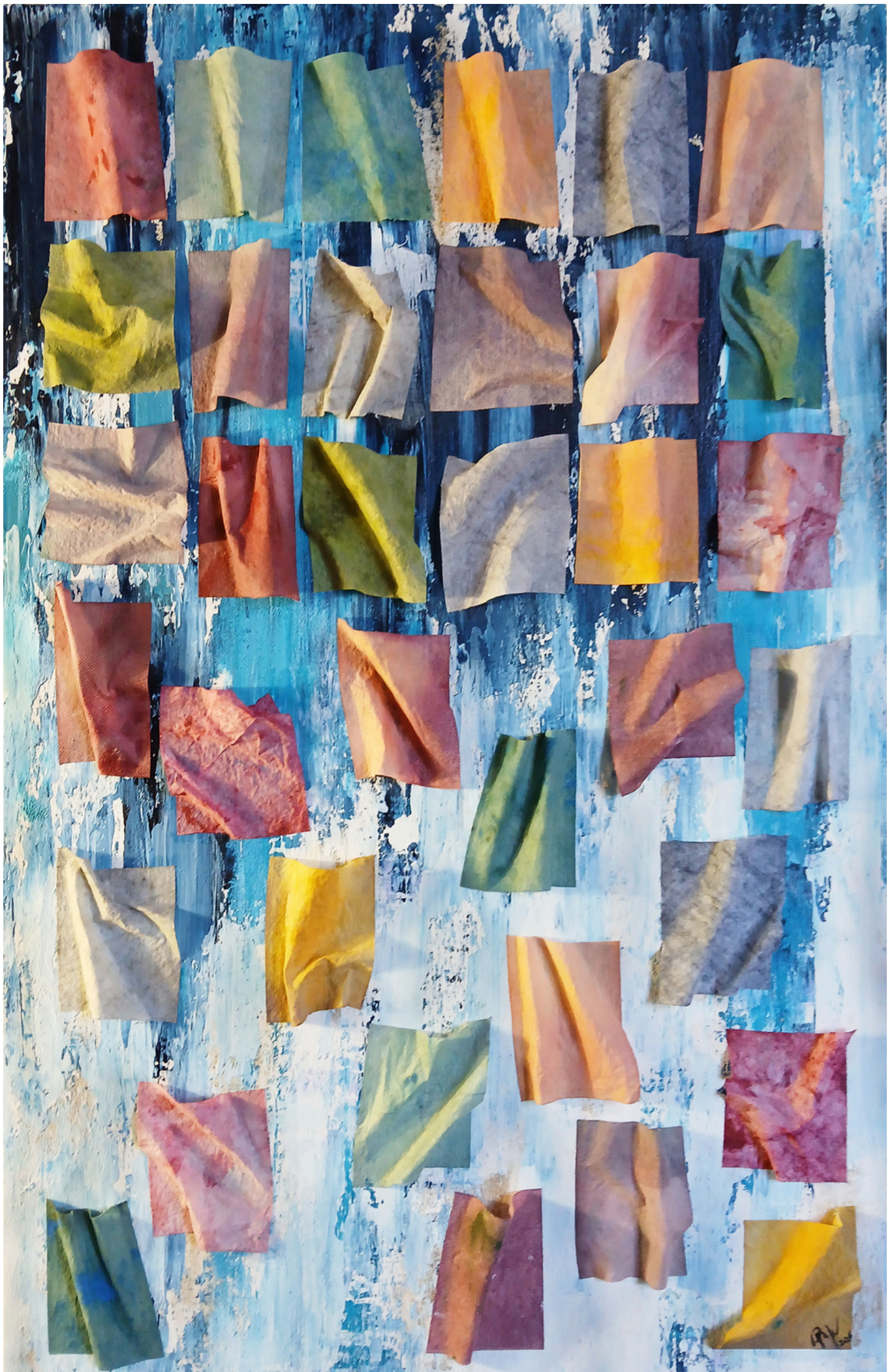
Püspök Anita: Labor-rituálé 110x70cm - Teljes nézet, szemből