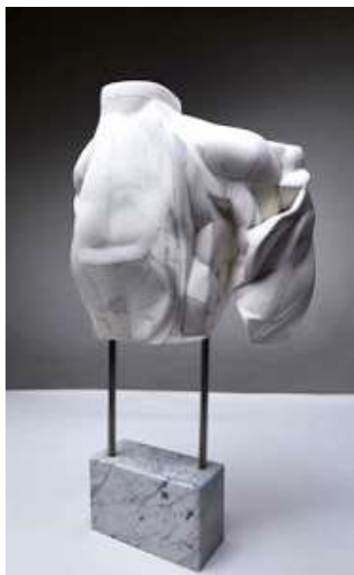
ANTAL MALVINA - SZÉKI TEMPÓ , papírkompozit, márvány, 81x60x23 cm.