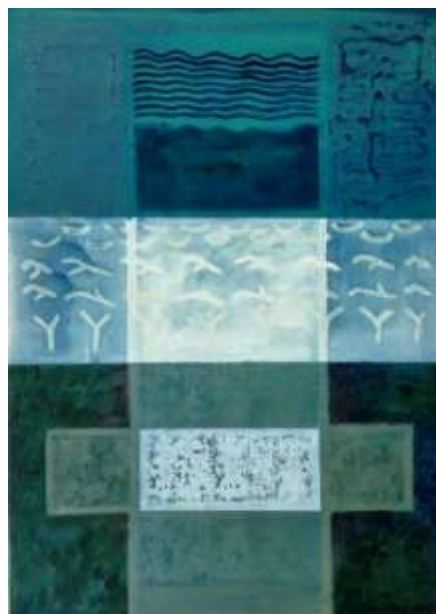
SZARKA HAJNALKA – ÁHITAT , akril, vászon, 50x70 cm. TÉL 2. akril, 70x50 cm.

TÉL 3. akril, 70x50 cm. email: szarkahajnalka@gmail.com mob: 20 593 6116,